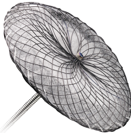
AMPLATZER™ Septal Occluder