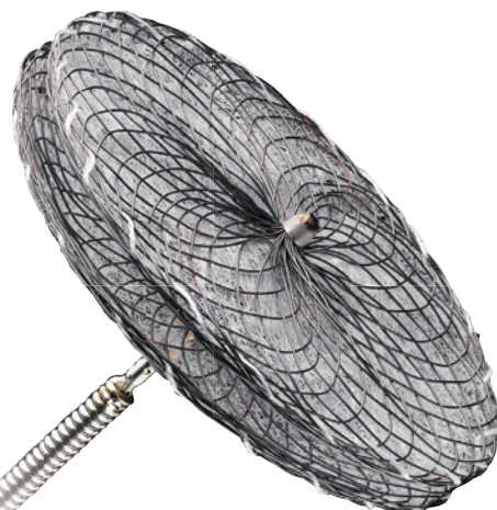
AMPLATZER™ Cribriform Occluder