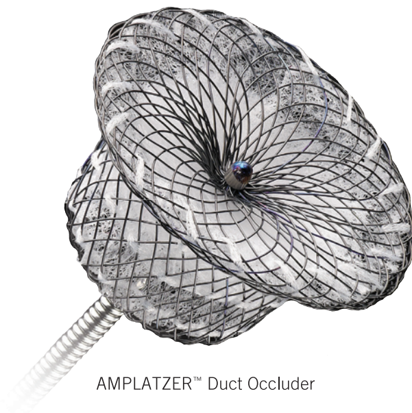
AMPLATZER™ Duct Occluder